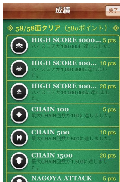
アチーブメントを集めよう！ (Game Center 機能)