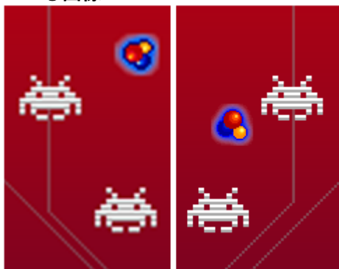
左：自動拡大でのグラフィックス 右：今回の対応により鮮明になったグラフィックス