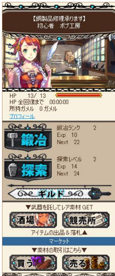
マイページイメージ