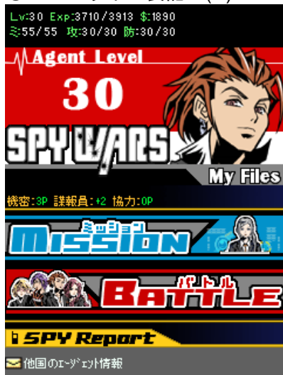
マイページイメージ