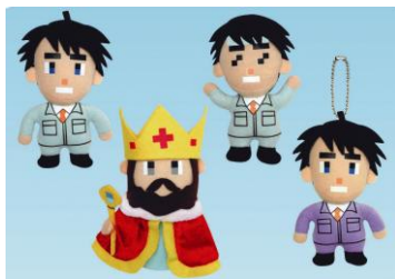
(C) FUJI TELEVISION (C) TAITO CORP.1978,2009

また、本イベントの開催に合わせ、上記のタイトーステーション6店舗限定で先行して「ゲームセンターCX マスコットぬいぐるみ」のプライズ(景品)を用意しております。