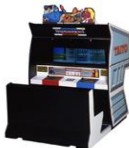
ニンジャウォーリアーズ