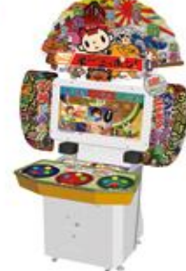
セニョール ニッポン！