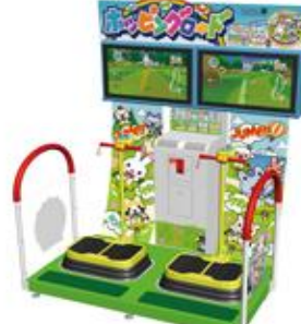
ホッピングロード